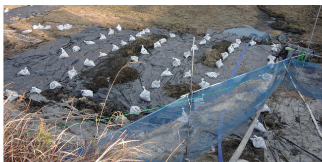
遮光シートやネットを用い、拡散を防止しながら駆除をします

兵庫県 (078-362-3389) またはお住まいの自治体窓口にご連絡ください。