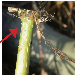
茎の節から再生する根