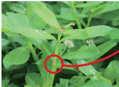
節は簡単にポキポキ折れる