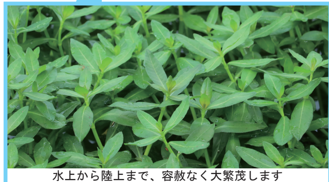
水上から陸上まで、容赦なく大繁茂します